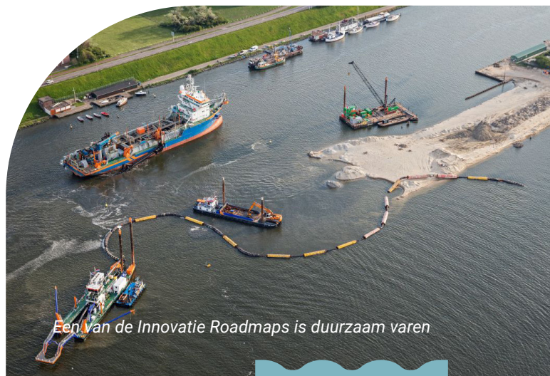
Een van de Innovatie Roadmaps is duurzaam varen

Dit is een belangrijk programma binnen de Innovatie Roadmaps. Het doel is om meer impact te organiseren met het open en onafhankelijk zakelijk glasvezelnetwerk in de regio en bij te dragen aan de ontwikkeling van digitale oplossingen voor maatschappelijke vraagstukken. Zowel voor de industrie als voor de samenleving.