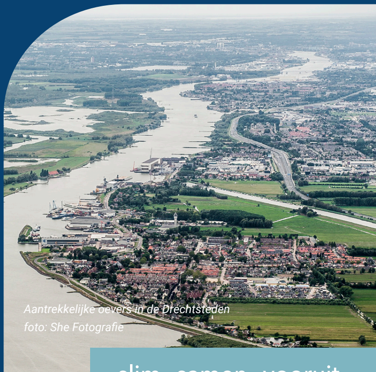
Aantrekkelijke oevers in de Drechtsteden

Kortom, de gemeente zorgt voor goede bereikbaarheid, voor een schone, groene en veilige openbare ruimte, voor ondersteuning aan inwoners die dat nodig hebben, voor scholen en onderwijsfaciliteiten, voor ruimte voor woningen, bedrijven, sport en cultuur.